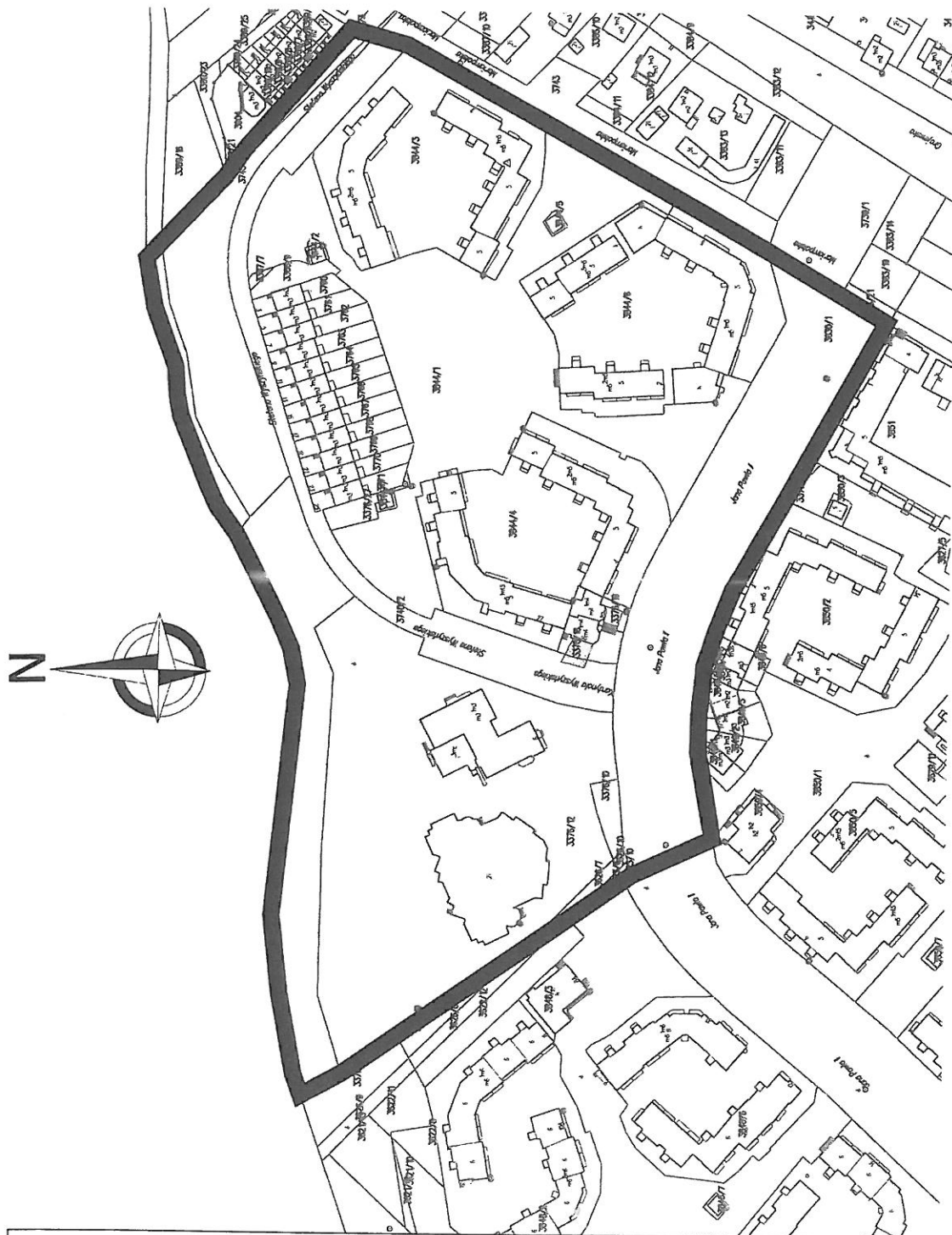
GRANICE TERENU OBJĘTEGO OPRACOWANIEM PLANU